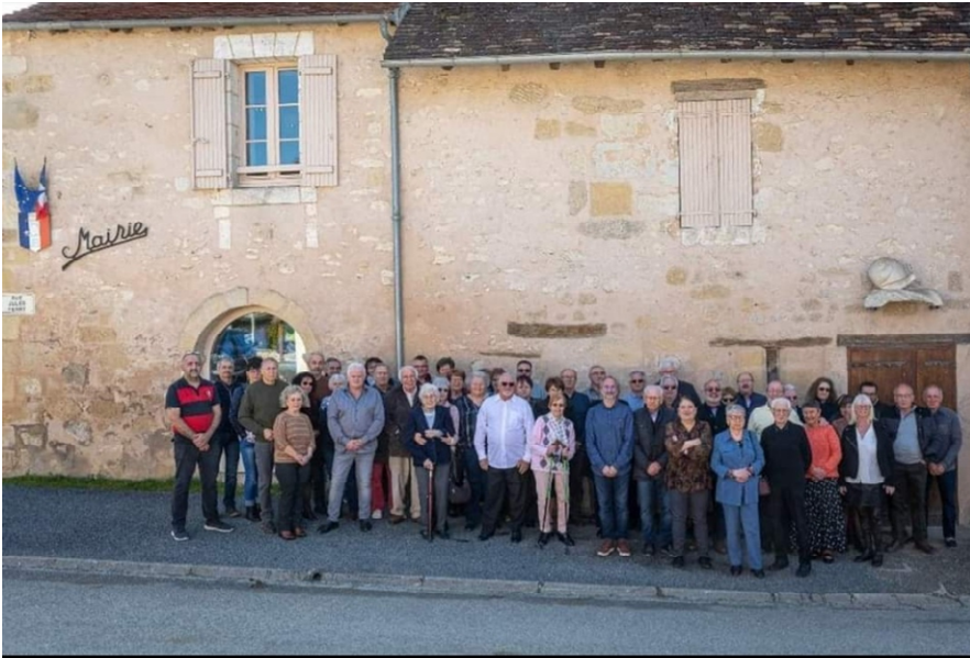
Photographie Jean-Baptiste DUARTE, Escoire